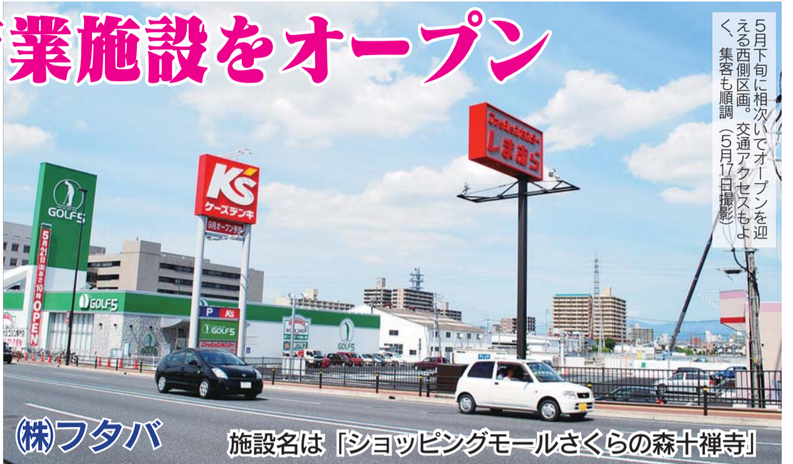
(株)フタバ 施設名は「ショッピングモールさくらの森十禅寺」