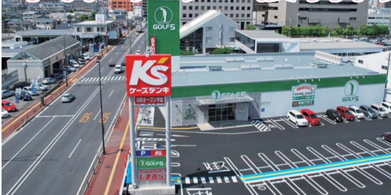
▲場所は国道3号線沿いのトヨタカローラ熊本南側（村田ビルから撮影）