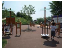
▲健康器具スペースは子どもから高齢者まで楽しむことができる