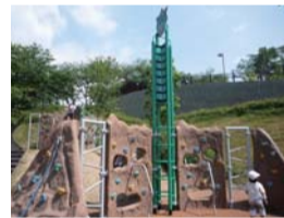
▲クライミング遊具の「グリーンドラゴン」

国道3号沿い、「道の駅・竜北」の対面に4月にオープンしたばかりの「竜北公園」。子どもが遊ぶための遊具だけではなく、ADL(日常生活動作能力)の回復などをねらった健康器具スペースもあるので大人も楽しめます。子どもに大人気の遊具、ローラー滑り台の「レッドドラゴン」は、なんと全長126m!ほかにも自然を感じることができる散策路やおまつり広場、野外ステージなどもあり、家族みんなでお弁当をもってかけても楽しそうですね。また、さまざまな植物が植えられており四季折々の表情を観察することができます。これからの季節は約5000株のアジサイが咲く予定です。