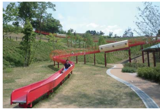
▲全長126mのローラー滑り台は子どもに大人気