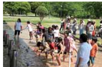
水に関する各種イベントも行われている水の科学館