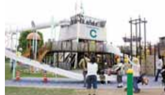
坪井川緑地公園にはテニスコートや運動場などもある。散歩コースとしても最適