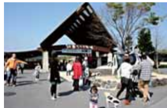
阿蘇ミルク牧場はたくさんの体験メニューがあり、約3.6haの芝生広場が自慢のカントリーパーク。入園料(大人1人300円、高校生以下 無料)を払えば、クラウドゴルフは無料で遊べる