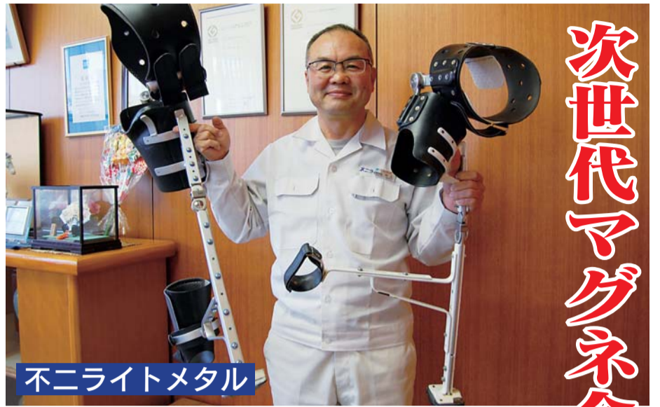
不二ライトメタル

観光農園の河野ぶどう園(宇城市松橋町)は昨年9月、携帯電話向けゲーム「コロプラ」と提携し、その効果で2千人が来園した。来園者が毎年数百人に留まっていた同園は、東京都の(株)コロプラが運営する携帯電話向けゲーム「コロニー生活☆PLUS(通称コロプラ)」の来店・販売促進サービス「コロカ」の集客効果に注目。昨年7月に無添加の自家製ジュースをコロプラ社に送り、提携に応募。社内の試飲で好評だった無ろ過のジュースを、コロカ提供に合わせて1本1800円、2千本限定で発売。コロプラ利用者が全国から集まり初回は発売、リピーターも出た。コロプラ利用者は携帯電話の位置情報測定機能で移動距離に応じてゲーム内でポイントを獲得。コロカ導入店舗で一定額購入すると、ゲーム内でも特別アイテムを購入できる。特典を店頭購入に限ることで実際に人が移動するため、導入店舗や移動経路沿いの経済効果が期待できる。利用者は124万人で、全国の平均月商は90万円という。