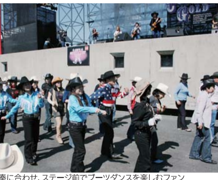
演奏に合わせて、ステージ前でブーツダンスを楽しむファン