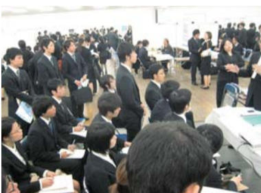
▲700人が参加した昨年のジョブカフェイベント