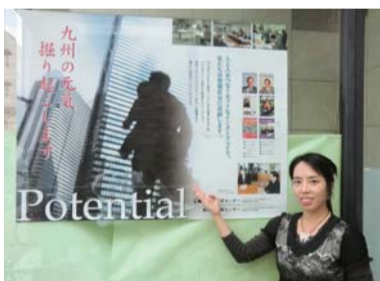
▲ポスターの仕上がり見本

対象●2012年3月卒業予定及び来春卒の大学・高専・短大・専門学校生と既卒・中途の採用を計画中の企業で、熊本県内に職場のある企業