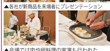
▲当日は約800人が来場 ▲各社が新商品を来場者にプレゼンテーション ▲会場では肉や卵料理の実演も行われた