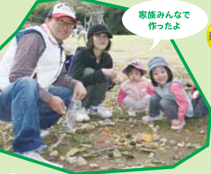
家族みんなで作ったよ

主催/くまもと経済/くま経プレス 特別協賛/南九州コカ・コーラボトリング株式会社 後援/熊本県教育委員会、熊本市教育委員会、FKK、TKU、KKT、KAB、NHK熊本放送局、FMK、FM791