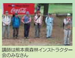
講師は熊本県森林インストラクター会のみなさん

開会式の後、熊本県森林インストラクター会の案内による立田山散策では、表情豊かな自然を満喫しました。その後、立田山自体をキャンパスに見立てたアースアートに挑戦。お昼からは、森の博士×クイズ、さわやかなコンサートを楽しみました。閉会式ではアースアート優秀作品の表彰と「森の博士認定証」を授与。大自然の中、さわやかな一日を楽しみました。