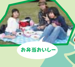
お弁当おいしいー