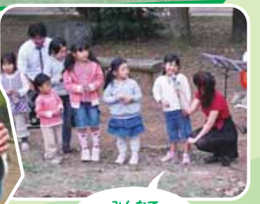
みんなで一緒に歌おう！