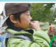
このどんぐり、栗みたいな味がする！

立田山の自然の素晴らしさを五感(見る、聴く、触る、におう、味わう)で感じようと全員で散策。どんぐりを食べたり、木の根をかじったり、葉の匂いをかいだり、小さな生き物を見つけたり、普段は触れることが少ない自然を満喫しました。