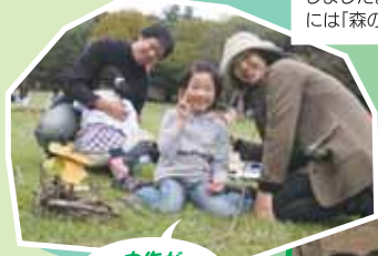
力作ができました