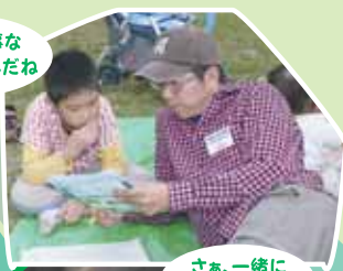
さあ、一緒に解いてみよう！