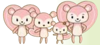
▲住宅保証機構キャラクター「まもりす」