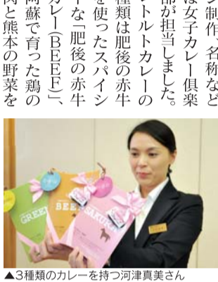
▲糖類ゼロのチューハイ

「196℃製法」により、レモンとライムの味を最大限に引き出し、無糖・無香料のクリアな味わいを実現したそうです。 同製法は196℃で瞬間凍結した果実を、パウダ