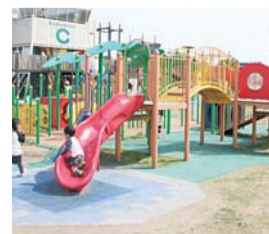
▲小さな子供たちが遊べる遊具も充実

熊本市中心部からもほど近い坪井川沿いにある公園。野球場やテニスコート、陸上競技場などのスポーツ施設や、遊水地を利用した緑豊かな芝生広場などのくつろぎの場があり、週末になると家族連れも多い公園です。30mのローラー滑り台をはじめ、152のアイテムから構成する大型遊具施設「ひごっこジャングル」は子どもたちに大人気。熊本城の石垣をイメージして作られたという展望台からの眺めも最高です。芝生広場などもあり緑豊かな公園にぜひ、お弁当を持って出かけてみては。