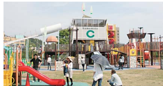
▲公園内にある大型遊具施設「ひごっこジャングル」

熊本市中心部からもほど近い坪井川沿いにある公園。野球場やテニスコート、陸上競技場などのスポーツ施設や、遊水地を利用した緑豊かな芝生広場などのくつろぎの場があり、週末になると家族連れも多い公園です。30mのローラー滑り台をはじめ、152のアイテムから構成する大型遊具施設「ひごっこジャングル」は子どもたちに大人気。熊本城の石垣をイメージして作られたという展望台からの眺めも最高です。芝生広場などもあり緑豊かな公園にぜひ、お弁当を持って出かけてみては。