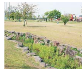
▲緑豊かな芝生が広がる公園内は散歩コースとしても最適です