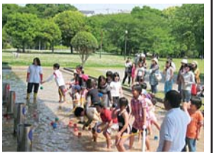
水に関する各種イベントも行われている水の科学館

●広い公園に一面が芝生の菊陽杉木公園さんさんでは、無料でボールも貸してもらえますよ。近くに図書館や温泉、物産館などがあって便利です。