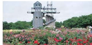
約3.6haの芝生広場が自慢のカントリーパーク。入園料(大人1人300円、高校生以下 無料)を払えば、グラウンドゴルフは無料で遊べる