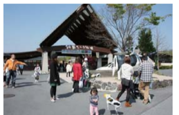
たくさんの体験メニューがあり、何度訪れてもあきない阿蘇ミルク牧場

●カントリーパークは、お弁当を持ってよく出かけています。遊具施設や物産館もあって大人も子供も楽しめますよ。