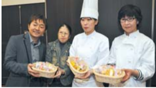
オリジナルクッキーを手に持つライオン工房、熊本テラス、なすな工房の関係者

オリジナルクッキーの販売を開始 熊本市水前寺公園のホテル熊本テラスはこのほど、社会福祉法人ライオン工房(熊本市戸島5丁目)、特定非営利活動法人なすな工房(熊本市富合町清藤)と共同で、オリジナルクッキーの製造販売を始めました。クッキーは食材からしれんこん、シヨウガ、塩トマト、ミカン、ブルーベリーとすべて県内で生産・製造されたものに加えて、熊本名物のトンコツ味を使用したものを含め6種類開発しました。価格は「みかんクッキー」と「ブルーベリークッキー」がそれぞれ300円、「辛子蓮根クッキー」と「こんこクッキー」がそれぞれ300円、「しょうがクッキー」と「塩トマトクッキー」がそれぞれ400円、「しよがクッキー」と「塩トマトクッキー」がそれぞれ400円入りで1500円となっています。同ホテルと県庁地下売店で販売しています。