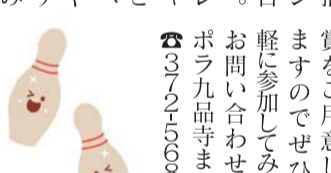
国産牛などが当たるボウリング3ゲームキャンペーン

国産牛などが当たるボウリング3ゲームキャンペーン スポラ九品寺 熊本市九品寺5丁目のスポラ九品寺では5月8日から、国産牛などが当たる3ゲームキャンペーンを実施します。キャンペーン期間中にボウリングを3ゲームプレイした人を対象に抽選で国産牛肉などが当たります。キャンペーン期間は7月半ばまで。抽選はキャンペーン終了後に行われ、後日お知らせします。また抽選にハズレた人からもWチャンスで商品券などが当たるかも。ぜひこの機会に家族や友人などとボウリングを楽しんでみ