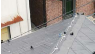
屋根に施工した電気ショックシステム

ハトの糞害、騒音被害で困っていませんか? 自宅の屋根やマシンのペランダなどに飛来するハトの糞害や騒音被害に悩まされている方は、いらっしゃいませんか? (有)ビルメイト(熊本市武蔵ヶ丘9丁目)は、被害状況や場所周辺環境などを分析し、忌避剤、プロテクター、防除ネット、電気ショックなどを組み合わせたハト対策で効果を上げています。被害が初期段階であれば、比較的飛来防止忌避剤を単体