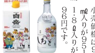
キャンペーン商品の一部、全部で8アイテムを発売中

「百岳ホークス応援キャンペーン2011」を実施中 人吉市合ノ原町の地場大手焼酎メーカー高橋酒造(株)と福岡ソフトバンクホークス(本社・福岡市)は、共同で「百岳ホークス応援キャンペーン」を開始しました。期間は今年5月未だの予定。共同で販売する商品に、希望小売価格は900円入り、951円、1,800円入り、1,960円です。