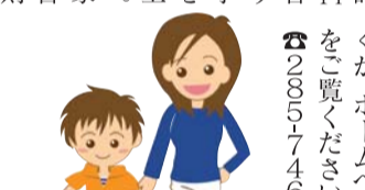
ひとり親家庭教育支援の申し込み受付中

ひとり親家庭教育支援の申し込み受付中 くまもと学習支援ネットワーク NPO法人くまもと学習支援ネットワーク(熊本市水前寺3丁目、江原寺3丁目)では、拠点に来塾して、対面方式による学習指導を行います。支援の申し込みを指導の期間は今年5月から来年3月まで。申込期間は5月11日までです。詳細は電話でお問い合わせください。お申し込みは、お電話で02857461