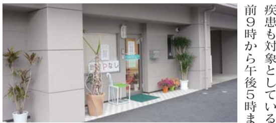
▲熊本市細工町2丁目に開院した「池上第二クリニック」