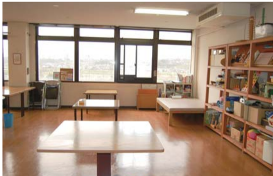
▲同院本館5階のリハビリテーションセンター内に新設した機能訓練室

場所は県道熊本高森線沿い、熊本市立五福小学校北側のマンション、グランドブルー五福1階に入居。院名は「池上第二クリニック」。フロア面積は約90㎡。診療室のほか、別室でデイクールームを備え、青年期の患者を対象にした精神科デイケアを行う。診療科目は精神科や心療内科のほか、不眠、神経症、うつ病、統合失調症、摂食障害、不登校、ひきこもりなどの疾患も対象としている。診療時間は午前9時から午後5時まで(水曜日は午前11時半まで)。休診日は第1・2・3土曜日と日曜・祝日。スタッフは看護師、精神保健福祉士、心理士、事務員の4人。