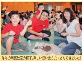
昨年の陶芸教室の様子、楽しい思い出がたくさんありました!

毎年多くのご家族からお申し込みをいただき恒例イベント「さわやか!一日陶芸教室」を今年も6月11日(土)に開催します。