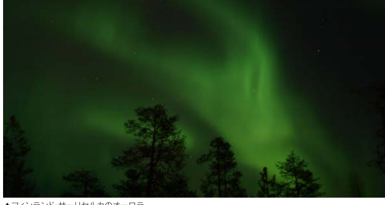
▲フィンランド・サリセルカのオーロラ

このイベントは、全国のココ・コーラで開催している「Live Positively -世界をプラスにまわそう-」プロジェクトに認定されています。詳しくは http://www.cocacola.co.jp/positively/positively.html をご覧ください