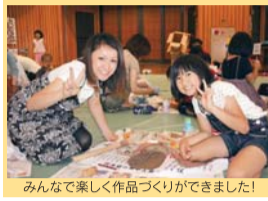
みんな楽しく作品づくりができました!

業は血や茶碗など形にしてもらうまで。焼き上げなどの工程は、当日指導していただく先生にお願ひします。そして、約1ヵ月後、みなさんの思いが詰まった結晶は、表情を変えた立派な作品に!親子一緒に作品を作り上げるひとときは、楽しい思い出を作る良い機会です。お気軽にお申し込み下さい。