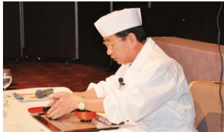
▲取った蓋は右斜めに置く