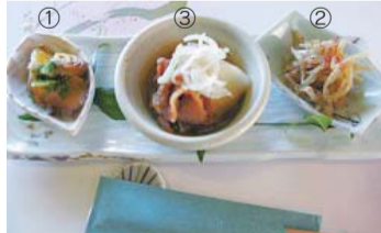
▲和食の三種盛の例。①②③の順で食べる

いただくときは、まず左から、そして右、最後に中央の順番にいただきます。まん中から食べ始めるのは、タブーです。