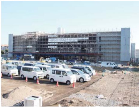
▲東本町の税務大学校熊本研修所東側で建設が進む東区役所