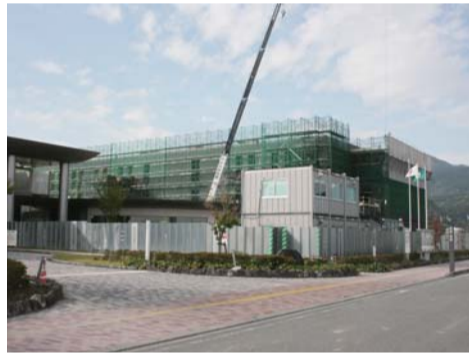
▲小島2丁目の西部市民センター敷地内に新設される西区役所。既存施設北側で工事が進む