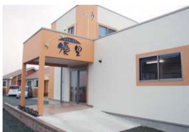
菊池市七城町に開設した通所介護施設「デイサービス優里」

名称は通所介護施設「デイサービス優里」。場所は県道1の菊池線沿いの中九州クボタ七城営業所北東側、同社敷地(2580㎡)内のデイサービス優里南側。建物は木造平屋建てで、床面積は244㎡。フロア構成は厨房(ちゅうぼう)、浴室(2室)、トイレなど。機能回復訓練のほか、健康科学士によるストレッチ・指圧を行う。通所定員は20人。開業時間は午前8時から午後5時まで。無休。スタッフは7人。