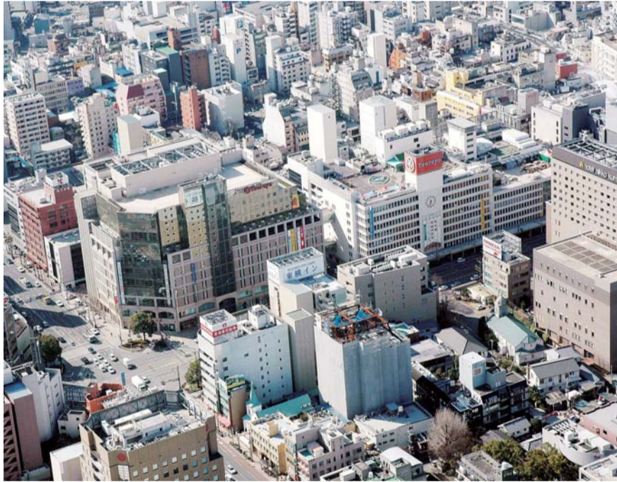
▲九州新幹線の全線開業から政令指定都市への移行と続く熊本市。この後に続くと思われる道州制の導入では「州都・熊本の実現」へ向け、ホップ、ステップ、ジャンプの戦略的取り組みが求められる（写真は水道町周辺）

権限、各種財源が移譲 政令指定都市への移行は、県から都市計画（線引きを除く）の決定、市内の国道（国道3号、57号、208号を除く）・県道の管理、教職員の任免など、都市計画から土木、教育、保健・福祉に至るまで、数多くの権限が移譲されるとともに、財政面でも石油ガス譲与税、軽油引取税交付金、宝くじ発行収益金などが交付され、中核市にない新たな財源が移譲される。また、移行後は、行政区が設置され、区役所を拠点として、地域の個性を活かしたきめ細やかなサービスが実施できるようになり、市議会議員や県会議員の選挙も区単位で行われる。