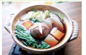
写真はビュアリイ肥後福のやの勤五郎鍋