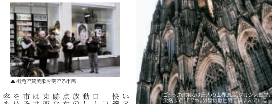
▲前高で観望も楽しめる内部

本日からアリス「航路」シリーズの第1号として、ドイツ・ライン河畔の街を訪ねて、威容誇るケルン大聖堂を訪ねてみる。 ケルン大聖堂は、ドイツ・ライン河畔の街を訪ねて、威容誇るケルン大聖堂を訪ねてみる。本日からアリス「航路」シリーズの第1号として、ドイツ・ライン河畔の街を訪ねて、威容誇るケルン大聖堂を訪ねてみる。