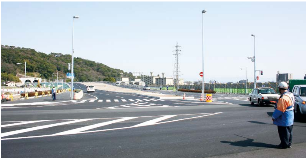
▲春日池上線と西回りバイパスが接続する交差点付近。熊本市西部とのアクセス改善が期待される

新たなまちづくりが進む熊本市周辺では熊本市の東西を結ぶ道路として、JR熊本駅西側で整備が進んでいた春日池上線（熊本市春日・同池上町、1870m）が3月19日に開通した。 同路線は市中心部から新幹線の高架下を通り、万日山トンネル（445m）を経由して池上町の野口清水線・通称西回りバイパスに接続する幹線道路。今回、整備を進めていた春日4丁目―池上町の1282mの区間が供用を開始。路線は片側2車線で自動車道や歩行者道を含めて幅30m。トンネル内には歩行者や自転車を通れるスペースなども広く取られ、さまざまな面で熊本市の東西を結ぶ路線として期待されている。