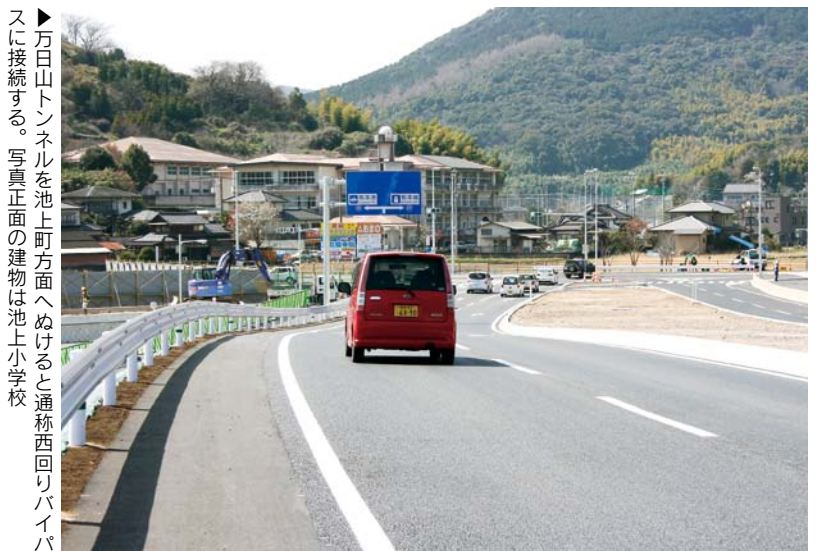
▶万日山トンネルを池上町方面へぬけると通称西回りバイパスに接続する。写真正面の建物は池上小学校