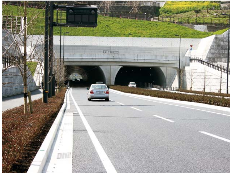
▲このほど開通した万日山トンネル。4車線で供用を開始し、トンネル内には歩行者、自転車などが通れるスペースなども広く取られている