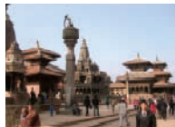
カトマンズの南に位置する古都・パタンのダルバール広場。中央奥に見えるのが17世紀に造られた石造りのクリシュナ寺院