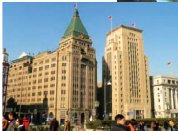
租界時代の洋館が立ち並ぶ外灘(わいたん)地区

アジアの金融、貿易センターを目指し開発が進む浦東地区。ひととき高い建物がアジアの高さを誇る東方明珠塔(468m)。外灘地区とともに夜はライトアップされる