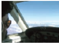
マウンテンフライトではコックピットも見学できる。眼下には7000、8000m級の山が連なるヒマラヤ山脈が間近に見える

2007年元旦。福岡空港からタイ・スワンナプーム国際空港を経由し、翌2日にネパールのトリブヴァン国際空港に到着。首都カトマンズ、ジャングルサファリが楽しめるチトワン国立公園(世界自然遺