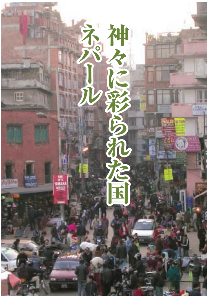
神々に彩られた国 ネパール

カトマンズの中心部アサン・チョーク付近の交差点。道路には車、バイク、自転車、歩行者がひしめき合う。カトマンズ盆地全体が世界遺産に登録されているが、急速な都市化の影響で危機遺産にも指定されている