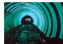
浦東地区と外灘を結ぶ観光トンネル。黄浦江の川底トンネル内を車両で走行する。ハイテクによる様々な色の光線が絶えず変化し、模様が映し出される

ていないいわゆる「流動人口」が約700万人とも言われ、計2000万人を超える中国最大の経済都市