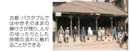
古都・バクタプルでは中世そのままの静けさが残り、人々のゆったりとした時間の流れに触れることができる

ナガルコットは標高約2100m。日が昇るにつれて刻々と色を変えるヒマラヤは絶景だ。その澄んだ空気と夜明けの眺めは寒さを忘れさせてくれる格別なものだった。(柳川)