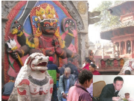
ヒンドゥー教・シヴァ神の化身のひとつで恐怖の神「カーラ・バイラヴ」。カトマンズの旧王宮付近・ハヌマン・ドカにある