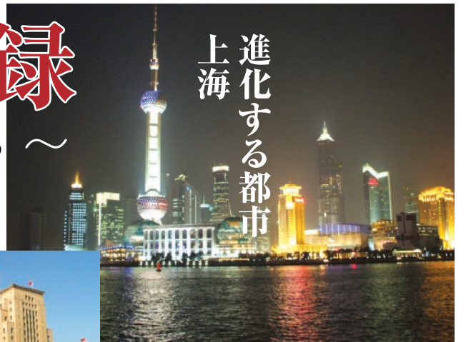
進化する都市 上海

アジアの金融、貿易センターを目指し開発が進む浦東地区。ひととき高い建物がアジアの高さを誇る東方明珠塔(468m)。外灘地区とともに夜はライトアップされる