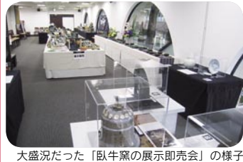
大盛況だった「臥牛窯の展示即売会」の様子

熊本市上通町のホテルオークス2階に位置する「オークスホール」。ご希望の予算や利用時間に応じて、空間をお客さまだけのプランでお楽しみください。貸しホールとしての利用も最適で、60,000円/日から承ります。また、ご好評のパーティープランは、お1人3,150円(2時間ドリンク込み)からご用意。お気軽にご相談ください。