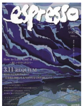
【エスプレッソ】 くまもと経済が発行するライフスタイル応援マガジン「エスプレッソvol.10」を10名様に