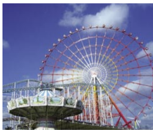
【グリーンランド】 荒尾市のグリーンランドより「ペア招待券」を3名様に

【ハガキ】〒860-8552(住所記載不要) くま経プレス「プレゼント」係 【H P】「くま経プレス」で検索 ※HPでの掲載は発行から1~2日後になります 応募締切: 2012年6月15日(金) ※ハガキは当日消印有効 ●みなさまのご応募お待ちしております。