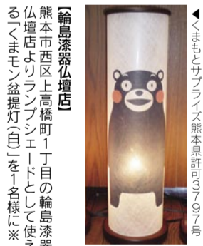
【輪島漆器仏壇店】 熊本市西区上高橋1丁目の輪島漆器仏壇店よりランプシェードとして使える「くまモン益提灯(白)」を1名様に※