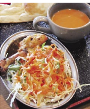
【エベレストキッチン】 エベレストキッチンより、A「特製トマトドレッシング」、B「特製コマドレッシング」をそれぞれ1名様に※