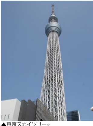
▲東京スカイツリー