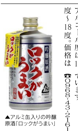
▲アルミ缶入りの吟醸原酒「ロックがうまい」

6月24日に 県産酒を楽しむ会 酒販店による任意団体「熊本の酒推進委員会」は6月24日、熊本市中央区東阿弥陀寺町の熊本全日空ホテルニュースカイで第7回くまもとの日本酒・焼酎を楽しむ会を開きます。 蔵元と消費者の交流や県産酒の普及などを目的に開催しています。 ☎379-0787 熊本の酒推進委員会 熊本の酒を楽しむ会 時から、開宴は同6時から。参加費は5千円。定員は500人。 同会は「蔵元と酒店、ユーザーという三者が交流し、さらに協力的な関係を築くための場。良い水と米で造られる熊本の酒を楽しまし、楽しんでほしい」と話しています。