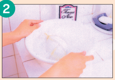
しばらく漬けこみこすり洗いた後、しっかりゆすいでタオルで軽く水分を取ります。