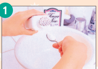
洗面器にぬるま湯を入れ洗剤を溶かします。