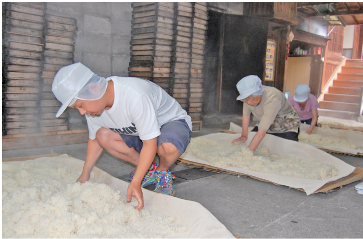
職人の手作業で丁寧に作られる麴づくり