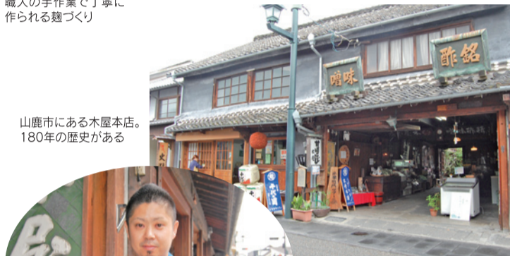
山鹿市にある木屋本店。180年の歴史がある