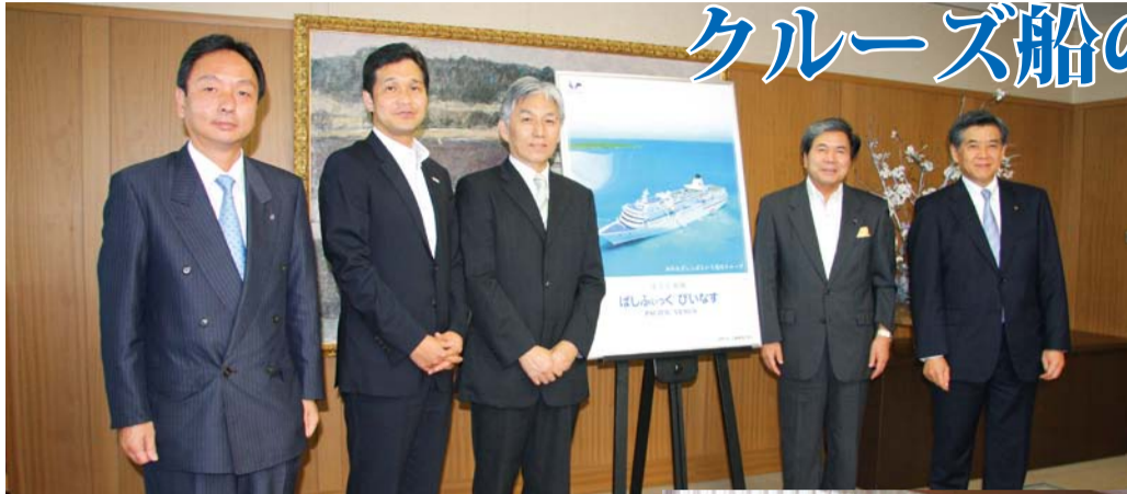
寄港決定報告の後、写真に収まる知事と熊本港ポートセールス協議会のメンバー

熊本県、熊本市、経済・貿易団... 熊本港ポートセールス協議会... 寄港するのは日本クルーズ客船... 浦島知事は「うれしニュース。熊本」