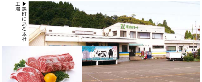
◀同社が加工などを手掛けた牛肉

島田農機商会... 精米設備設計製造の島田農機商会... UNIDOは開発途上国などの工業基盤整備支援を行う国連専門機関... 導入は2台。