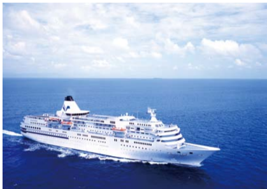
熊本港に初寄港するクルーズ客船「ばいびい」

熊本県、熊本市、経済・貿易団... 熊本港ポートセールス協議会... 寄港するのは日本クルーズ客船... 浦島知事は「うれしニュース。熊本」