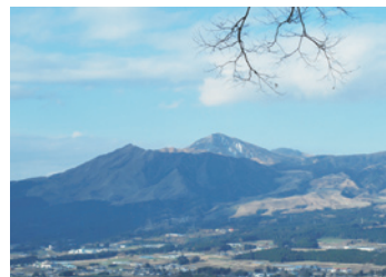
▲南阿蘇「自然葬の里」からの眺め

現地に到着すると、なんといっても埋葬場所からの眺めの良さに目を奪われてしまいました。見学会に参加した人はこの眺めに納得して、自然葬の申し込みをする人が多いそうです。