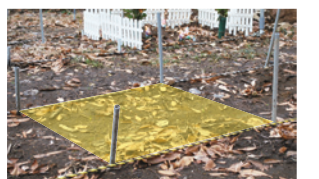
▶写真黄色のスペースが1区画。墓は建てないが墓地であるため、穴を掘って遺骨を入れ、土をかぶせる

通常、山や海で散骨する場合は遺骨を粉砕しなければいけませんが、ここは墓地であるため、粉砕する必要がなく、遺族にとっても抵抗が少ないようです。自然葬を希望する場合は最初に利用料が必要ですが、管理費や年会費などその後の費用はかかりません。