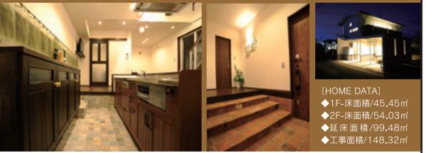
[HOME DATA] ◆1F-床面積/45.45㎡ ◆2F-床面積/54.03㎡ ◆延床面積/99.48㎡ ◆工事面積/148.32㎡

リビングを広く設けずキッチン前には対面型のカウンターを設置するなど、キッチン周りで自然と対話ができるようこだわった間取り