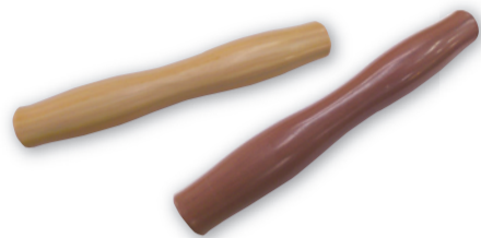
▲手すり「ユニップ」に新たに追加する木目調カラー。濃淡2色を用意する

総合建材商社の清永宇蔵商店(熊本市九品寺6丁目)は来年1月、同社が取り扱う「ユニバーサルデザイン手すり「ユニップ」のカラーバリエーション」に木目調を追加する。同商品は従来の手すりに凹凸をつけて人が握る際のグリップ力向上を図ったもので、同社と福岡金網工業(福岡市博多区)、大鐵(大分市日吉原)が共同開発した。ステンレス製と樹脂コーティングの2種類あり、今回カラーバリエーションを追加するのは樹脂コーティングの「ユニップカラー」。これまでの14色に木目調の濃淡2色を追加する。