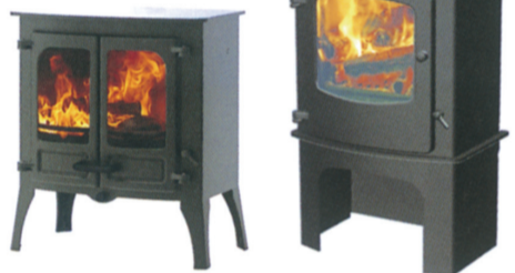
▲BESSシリーズをご成約の方にチャーンウッド社製の薪ストーブ等をプレゼントする

BESS特約店熊本熊本市中央区上水前寺2丁目)では来年3月31日まで薪ストーブをテーマにした秋冬フェアを開催しています。期間中、BESSが販売する対象シリーズをご成約の方に、シリーズに応じて様々な特典をご用意。ストーブスペースをはじめ様々なオプションに活用できる応援クーポンや、チャーンウッド(イギリス)の薪ストーブも選べるポイントもプレゼント。同社では「近年、憧れの薪ストーブのある暮らしを実践する人が増えてきました。心地よい暖房器具としての実用性とともにインテリアとしても高い人気があります。」と話しています。