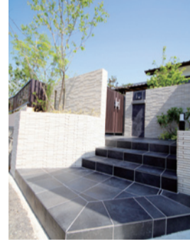
◀「高級感ある和モダン」をテーマにした庭リフォーム(写真下がリフォーム前)