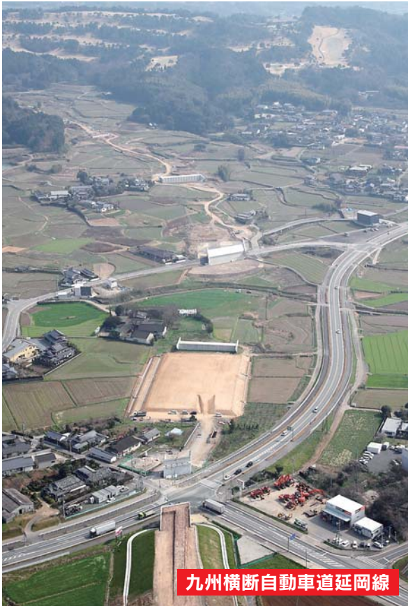
九州横断自動車道延岡線

▲嘉島ジャンクションから山都町方面に向け工事が進む九州横断自動車道延岡線、小池橋周辺。奥はチサンカントリー御船