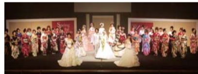
▲昨年のプライダルコレクション&振袖・袴ショー

ウエディングマインは2月18日(月)、熊本県立劇場演劇ホールで「2013 プライダルコレクション & 振袖・袴ショー」を開催します。 最新のウエディングドレス、成人式振袖、メンズタキシード&袴、卒業式用袴など多数 出演。開演は午後7時(開場6時半)、入場は無料です。これから結婚の方、成人式、卒業される方は必見です。ご家族揃ってご来場ください。 0372-8077