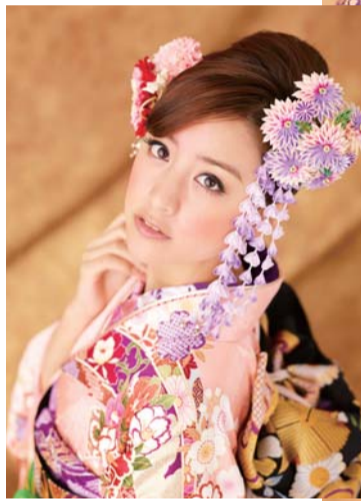
▲レンタル振袖は、今人気の新古典柄やキュートな色づかいの振袖など、色、柄ともにたくさんの振袖の中から選ぶことができる