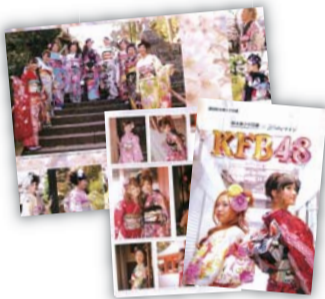
▲昨年発行した「別冊熊本美少女図鑑 KFB48」

振袖をレンタルして熊本美少女図鑑に載ろう くまもと美少女図鑑 KFB48 募集中! ウエディングマイン 「熊本美少女図鑑」と「ウエディングマイン」のコラボ企画で、昨年好評だった「別冊熊本美少女図鑑 KFB48」が今年も実現。5月上旬の発行予定で現在、振袖モデル48人を募集中です。 対象は、ウエディングマインでレンタル振袖を予約された2014(平成26)年度成人式の女性です(応募者多数の場合は選考有り)。あなたも友達と一緒にハタチの思い出を作りませんか。2月2