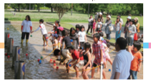
水に関する各種イベントも行われている水の科学館