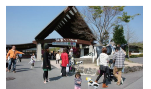
たくさん体験メニューがあり、何度訪れてもあきない阿蘇ミルク牧場