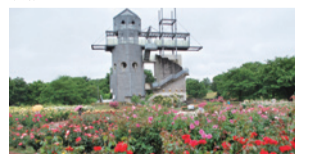
約3.6haの芝生広場が自慢のカントリーパーク。入園料(大人1人300円、高校生以下 無料)を払えば、グラウンドゴルフは無料で遊べる