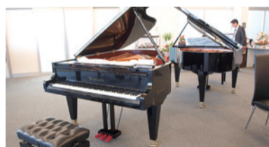
▲ベーゼンドルファーのピアノ2台も展示販売