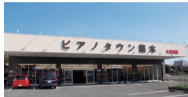
▲植木町舞尾にオープンした「ピアノタウン熊本」