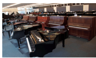
▲ヤマハの新品全台的ほか、中古ピアノなど約100台を展示販売

楽器販売・音楽教室運営の大谷楽器店(熊本市中央区上通町)はこのほど、同市北区植木町舞尾にピアノ販売の新店舗「ピアノタウン熊本」をオープンした。場所は国道3号沿い、ショッピングセンター「ウエッキー」北側。敷地面積約1220㎡、鉄骨平屋建て、店舗面積約445㎡。ヤマハ製ピアノの新品をアツプライトピアノからグラランドピアノまで全品番に加え、電子ピアノや中古ピアノなど、合わせて約100台を展示販売する。また、ピアノの世界3大メーカーのひとつであるオーストリアのベーゼンドルファー社のピアノ2台を展示販売する。中古ピアノの買い取りや調律の申し込みも受け付ける。営業時間は午前10時から午後7時まで。定休日は火、水、木曜(祝日は営業)。駐車場は16台収容。