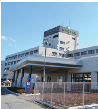
▲完成した中央診療棟(救急センター入口側)