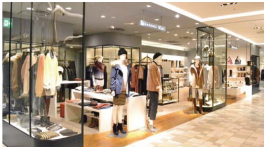
▲1階にオープンした「アハウス エル エ エル」