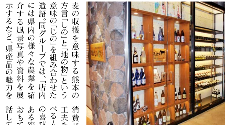
▲農産物産物のブランド戦略のアンテナショップとしてオープンする農家レストラン「しのじの」

JA熊本経済連グループ(熊本市中央区南千反畑町)は10月31日、同市中央区下通1丁目に農産物を使った農家レストラン「しのじの」をオープンする。JAグループ熊本の強みを活かして、牛肉、豚肉、野菜、果実、米など新鮮で高品質の食材を使用したメニューを提供し、熊本の産物を使った農産物を使ったメニューを提案する。