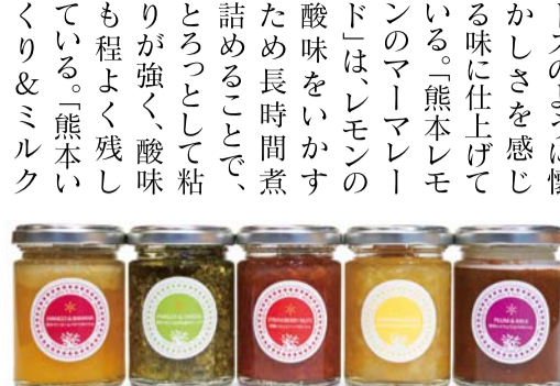
▲第一弾となる5種類のジャムやデザート

同社では「照明や音響なども効果的に使いながら、動物たちのパフォーマンスを最大限に引き出す」と話している。