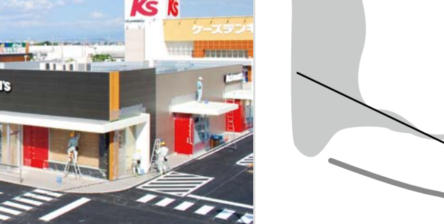
▲九州リースサービス(本社・福岡市)が、宇土市水町の国道3号と57号交差点の北東角地に建設している「クロス21UTO」。マックスバリュ、ケーズデンキ、スポーツデポなど13店が出店予定で、年間集客240万人を目指している