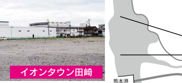
▲熊本市西区田崎では熊本市道を挟んで近隣型のショッピングセンター(NSC)2店舗の出店準備が進む。写真左側が年内オープンを目指す建設が進むイオンの「イオンタウン田崎(仮称)」建設予定地