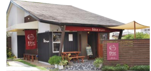
▲合志市幾久富にあるパン店フェテ・ド・パン

パン菓子類の製造販売のジャムは、いりすももの優しい酸味が練乳ミルクの甘みを加え、好んでジャムとミルクをかき混ぜて食べる。熊本パセリ&オニオンドーナツを立ち上げた。ブランド名は「フィロドジュエリー」。