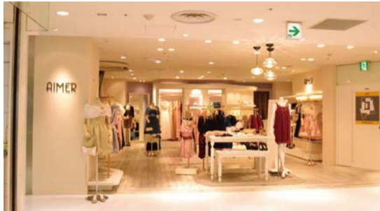
▲2階にオープンしたレディスフォーマルショップ「エメ」