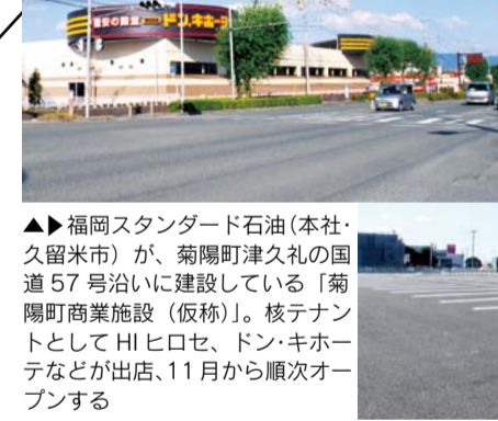
▲福岡スタンダード石油(本社・久留米市)が、菊陽町津久礼の国道57号沿いに建設している「菊陽町商業施設(仮称)」。核テナントとしてHIヒロセ、ドン・キホーテなどが出店、11月から順次オープンする