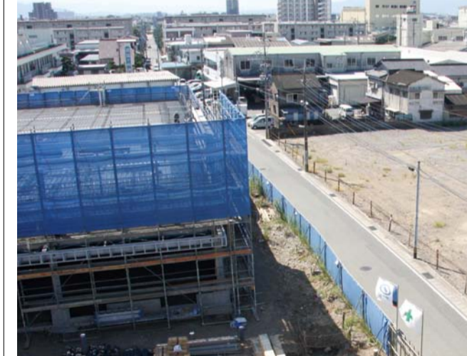
▲熊本市西区田崎では熊本市道を挟んで近隣型のショッピングセンター(NSC)2店舗の出店準備が進む。写真左側が年内オープンを目指す建設が進むイオンの「イオンタウン田崎(仮称)」建設予定地

同社では「照明や音響なども効果的に使いながら、動物たちのパフォーマンスを最大限に引き出す」と話している。