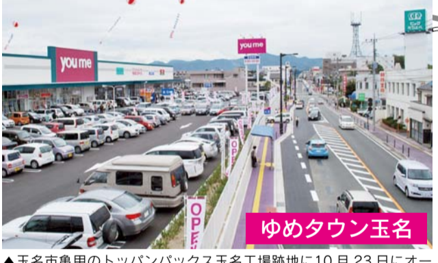
▲玉名市亀甲のトッパンバックス玉名工場跡地に10月23日にオープンしたイズミの「ゆめタウン玉名」。国道208号を挟んだ向かい側には地場スーパーのビッグミカエル玉名店(本社・菊池市)がある