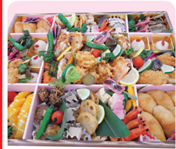
※写真は鉢盛 10,000円分です

上通町にある仕出し、ケータリング専門店「仕出しひとしな」では、季節感溢れる旬の素材を使った特製弁当をご提供致します。大人数の宴会や会議時に人気の鉢盛(3800円~)、法事弁当や祝事弁当など種類も豊富にご用意。姉妹店「焼肉ハウス バリバリ」とコラボした焼肉弁当(1575円~)も大人気の商品です。また、1万円以上ご予約のお客様へは配達も致します(熊本市内のみ)。場所や個数、内容などご遠慮なくお問い合わせください。