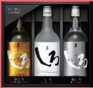
「金銀しろ」720ml×3本セット(25度) 参考小売価格 ¥3,938(税込)