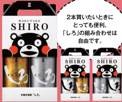
「しろ」720ml 本格米焼酎2本セット お値段は組み合わせて変動します。