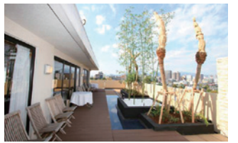
▲リゾート感漂う植栽などを整備した最上階「風庭」のテラス

また同ホテルの最上階(6階)の宴会場「風庭」は、市街地側に面したテラスを改装。テラス側全面に、リゾート感漂う植栽を整備したほか、中央部に池なども整備。水と緑豊かなリゾート空間として、夜はライトアップ同ホテルでは「落ち着きのある、大人の遊び場をテーマに、「和」と「リゾート」の2つの上質空間をご用意しています。特別な日のお祝いや各種宴会、婚礼など幅広く活用していただければ」と話している。