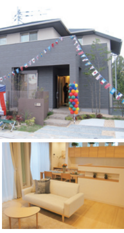
▶ページ系の落ち着いた色合いでまとめられたリビング

同社では、「試住」をコンセプトに宿泊体験していただくことで、カタログだけでは分からない当社の住宅性能を存分に体感していただきたい」と話している。