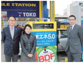
▲BDF5%混合の軽油燃料「くまな5.0」を販売

同給油所で軽油に5%混合した「B5燃料」を販売する。CO2排出が少ないなど環境に負荷の少なく軽油と同様にディーゼルエンジンに使用できる。同燃料の普及を目的に導入した。B5燃料を県内で製造・販売するのは県内では初。価格は軽油と同額で販売する。