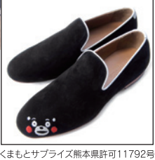
▶「くまモン」の刺繍が入った高級スリッポン