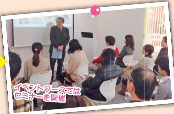
イベントブースではセミナーを開催

資金づくりやローンの組み方を聞きたい！図面の相談がしたい！見積もりもお願いしたいな…という方は相談窓口へ！女性スタッフの方が親切に分かりやすく教えてくれますよ。