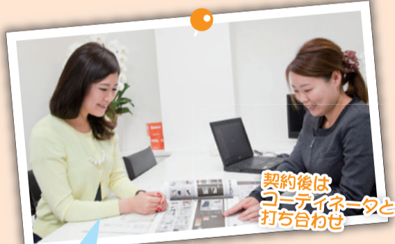
契約後はコーディネータと打ち合わせ

十分に下調べした後、エスケーホームで家を建てる！そう決まったらご契約へ。契約までの間、何度でも来店できるから納得してご契約できるシステムです。