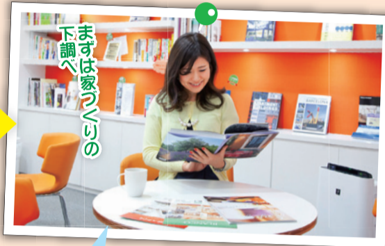
まずは家づくりの下調べ

店内に入るとスタッフの方が笑顔で迎えてくれました。パステルカラー調でとっても明るく開放感溢れる店内。受付を済ませ、さあ、これから家づくり体験スタート！