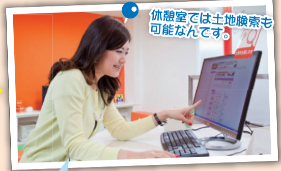
休憩室では土地検索も可能なんです。

休憩室の住宅関連雑誌を見て、気になる情報をチェック。こんな素材がいいなあ～、こんな間取りがいいなあ～などイメージがわいてきます。